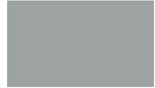
Clean Colorbond® steel Alloy Grey