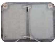
เหล็กเคลือบซิงคาคุม

หมายเหตุ: รูปภาพนี้เกิดจากการวางแผ่นตัวอย่างไว้ริมทะเลเป็นเวลา 12 ปี