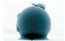
ภาพจากกล้องจุลทรรศน์แสดงให้เห็นว่ามีฝุ่นฝังติดอยู่บนพื้นผิวของเหล็กเคลือบสีทั่วไป