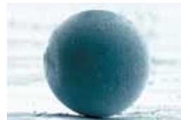
ภาพจากกล้องจุลทรรศน์แสดงให้เห็นว่าฝุ่นไม่ฝังติดบนพื้นผิวของเหล็กเคลือบสี Clean Colorbond®