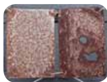
เหล็กเคลือบสังกะสี (G.I.)

หมายเหตุ: รูปภาพนี้เกิดจากการวางแผ่นตัวอย่างไว้ริมทะเลเป็นเวลา 12 ปี